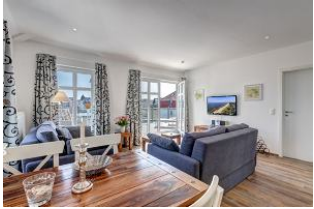
Essplatz mit Blick in den Wohnbereich