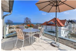
Dachterrasse mit tollem Meerblick