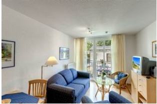
heller Wohnbereich mit Fernseher