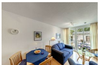
Essbereich und Wohnzimmer

Direkt an der Strandpromenade mit BALKON und FAHRSTUHL im Haus! Schönes geräumiges 2-Zimmer-Apartment mit moderner guter Ausstattung. Separates Schlafzimmer, Wohnzimmer mit Küchenzeile und Essplatz, Duschbad, Balkon zur Westseite mit Abendsonne. Die Wohnung verfügt über einen Tiefgaragen-Pkw-Stellplatz. In der Garage können auch Fahrräder und ähnliches untergestellt werden. In unserer "Villa Germania" nebenan gibt es eine Sauna. Von der "Villa Aquamarina" aus können Sie das Ortszentrum und die bekannte Ahlbecker Seebrücke in ca. 3 Minuten zu Fuß erreichen. Zum Strand sind es 50 m.