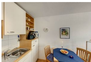
Küche mit Esszimmer