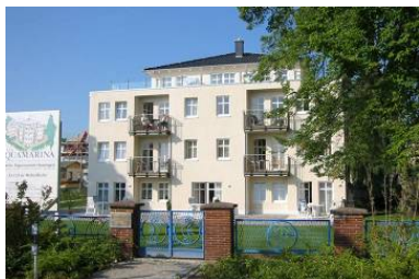
Architekturansicht "Villa Aquamarina" von der Promenade