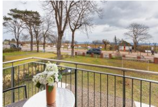
Balkon im Winter