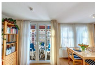
Essbereich mit Blick auf die Terrasse