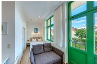
Kombinierter Wohn- / Schlafraum

STRANDNAH! Nur ca. 100 m zur Strandpromenade mit BALKON! Gemütliches 1-Zimmer-Apartment mit guter Ausstattung. Wohn-/Schlafraum mit Doppelbett und Sitz-/Sofaecke, Küchenzeile mit Essplatz, kleines Duschbad mit großer walk-in-Dusche, Balkon. Die Wohnung verfügt über einen Pkw-Stellplatz. Abstellraum für Fahrräder und ähnliches ist vorhanden. Eine Sauna in der "Villa Germania" kann kostenpflichtig genutzt werden. Vom Haus aus können Sie das Ortszentrum und die bekannte Ahlbecker Seebrücke in ca. 3 bzw. 5 Minuten zu Fuß erreichen.