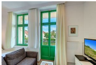
Küchenzeile und Eßplatz