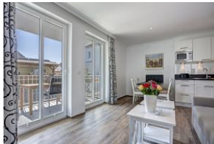
Blick zum Balkon