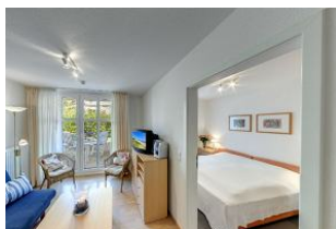
Blick in das Schlafzimmer