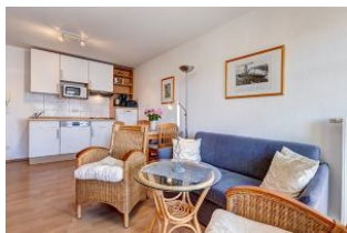
Wohnbereich, Essbereich, Küchenzeile