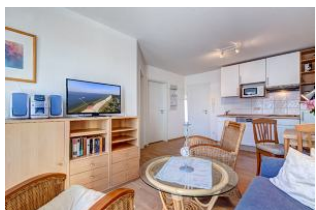
Wohnbereich, Essbereich, Küchenzeile

1. Reihe, direkt an der Strandpromenade mit BALKON und FAHRSTUHL im Haus! Schönes gemütliches 2-Zimmer-Apartment mit moderner guter Ausstattung. Separates Schlafzimmer, Wohnzimmer mit Küchenzeile und Essplatz, Duschbad, Balkon nach Osten - zum Frühstück in der Sonne mit SEEBLICK. Die Wohnung verfügt über einen Tiefgaragen-Pkw-Stellplatz. In der Garage können auch Fahrräder und ähnliches untergestellt werden. In unserer "Villa Germania" nebenan gibt es eine Sauna. Von der "Villa Aquamarina" sind es zum Ortszentrum und der Seebrücke ca. 3 Minuten zu Fuß. Zum Strand sind es 50 m.