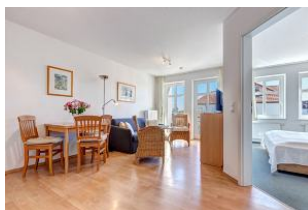
Wohnbereich, Essbereich, Blick zum Schlafzimmer