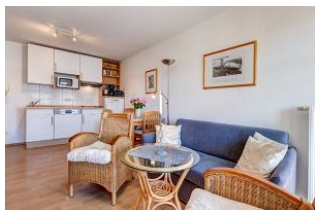
Wohnbereich, Essbereich, Küchenzeile