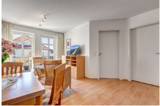
Essbereich, Wohnbereich, Blick zur Balkontür