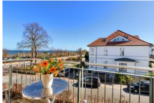
Balkon mit Ausblick