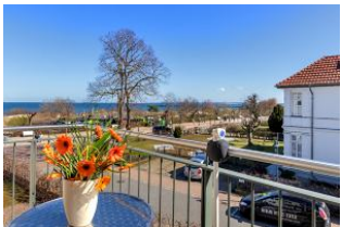
Balkon mit Ausblick