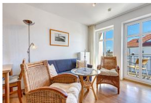
Wohnbereich Sitzecke, Blick zur Balkontür