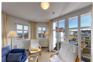
Wohnbereich mit Seeblick

Direkt an der Strandpromenade mit SEEBLICK und FAHRSTUHL im Haus! Schönes geräumiges 2-Zimmer-Apartment mit hochwertiger Ausstattung. Separates Schlafzimmer, Wohnzimmer mit Küchenzeile und Essplatz, Duschbad, Balkon nach Osten - zum Frühstück in der Sonne. Die Wohnung verfügt über einen Tiefgaragen-Pkw-Stellplatz. In der Garage können auch Fahrräder und ähnliches untergestellt werden. In unserer "Villa Germania" nebenan gibt es eine Sauna. Von der "Villa Aquamarina" aus können Sie das Ortszentrum und die Ahlbecker Seebrücke in ca. 3 Minuten zu Fuß erreichen. Zum Strand sind es 50 m.