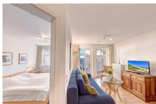
Blick in den Wohnraum