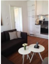
Wohnraum mit offener Küche