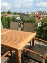
Terrasse mit Garten