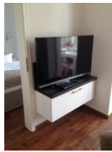
großer Flachbild TV