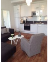
Wohnraum mit offener Küche