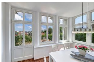
Essplatz in verglaster Veranda

Schicke 4-Zimmer-Wohnung mit Veranda und Terrasse - mit schönem weitem Blick! Die Wohnung ist elegant im Altbau-Stil eingerichtet und komfortabel ausgestattet. Sie wurde 2016 komplett renoviert mit Fußbodenheizung. Die Wohnung verfügt über drei separate Schlafzimmer, jeweils mit zugehörigem ensuite-Bad, Wohnzimmer mit Küchenzeile und Essplatz in der Veranda. Von den drei Bädern sind zwei Duschbäder und eines ein Wannenbad. Die Wohnung verfügt weiter über einen Eingangsflur mit Garderobe. Aus der Veranda gelangt man auf die möblierte Terrasse und in den Garten. Ein Pkw-Stellplatz ist inklusive, ein zweiter Parkplatz kann hinzugemietet werden. Die Villa Margarete steht etwas erhöht in der Bergstrasse, wodurch sich ein schöner Blick ergibt. Die Wohnung befindet sich im EG, etwa 300m zur Strandpromenade. Zum Ortszentrum und der bekannten Ahlbecker Seebrücke sind es ca. 8-10 Minuten zu Fuß.