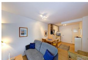
Wohnbereich und Küchenzeile