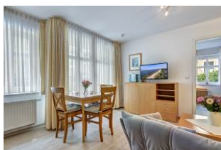
Wohnen, Essen, Blick zum Schlafzimmer