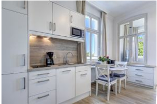
Küchenzeile und Essbereich