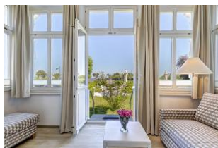
Veranda mit direktem Gartenzugang und dortiger Terrasse