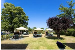
Garten mit Terrassen und Strandkörben (Mai bis September)