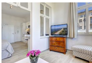
Veranda mit Blick zur Küchenzeile