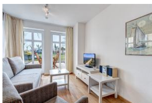
Wohnbereich mit Blick zur Terrasse