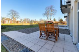
Terrasse mit Blick in den Garten und zur Promenade