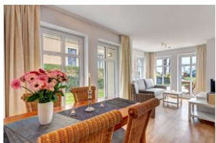
Essplatz und Blick in den Wohnbereich und zur Terrasse

1. Reihe, direkt an der Strandpromenade mit TERRASSE zur Seeseite! FAHRSTUHL im Haus! Schönes 3-Zimmer-Apartment mit moderner guter Ausstattung. Zwei separate Schlafzimmer, Wohnzimmer mit Essplatz, Küchenbereich, Duschbad, Gäste-WC, Terrasse zur Promenadenseite, zus. kleine Terrasse neben dem Eßplatz. Die Wohnung verfügt über einen Tiefgaragen-Pkw-Stellplatz. In der Garage können auch Fahrräder und ähnliches untergestellt werden. In unserer "Villa Germania" nebenan gibt es eine Sauna. Von der "Villa Aquamarina" aus können Sie das Ortszentrum und die bekannte Ahlbecker Seebrücke in ca. 3 Minuten zu Fuß erreichen. Zum Strand sind es 50 m.