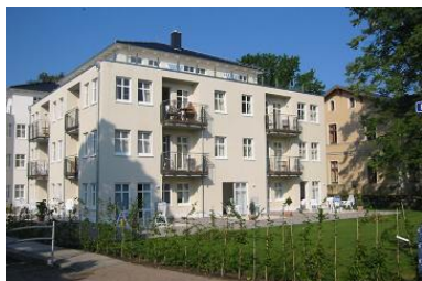
Hausansicht "Villa Aquamarina" von der Promenade mit Garten und Terrassen