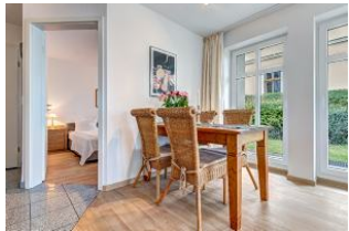
Essplatz und Blick in Schlafzimmer 1