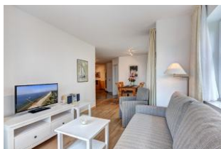
Wohnbereich mit Blick zum Essplatz