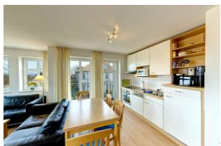
Küche mit Essbereich