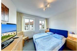
Schlafzimmer mit Fernseher