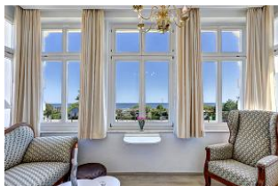
Veranda mit Seeblick