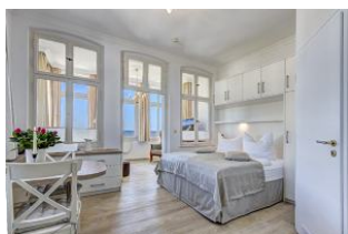
Blick in die Wohnung mit Seeblick

Direkt an der Strandpromenade mit herrlichem SEEBLICK aus der Veranda! Schönes 2 - Zimmer - Apartment mit gemütlicher und guter Ausstattung. Kombiraum mit Doppelbett, Küchenzeile mit Essplatz, Duschbad und Veranda als Wohnraum mit direktem Seeblick. Die Wohnung verfügt über einen Pkw-Stellplatz. In der Garage können Fahrräder und ähnliches untergestellt werden. Im Haus gibt es eine Sauna. Von der "Villa Germania" aus können Sie das Ortszentrum und die bekannte Ahlbecker Seebücke in ca. 3 Minuten zu Fuß erreichen. Zum Strand sind es 50 m. Von Mai bis September ist ein Strandkorb im Tagespreis enthalten.