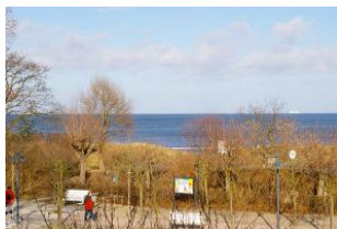
Seeblick aus der Veranda