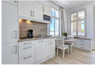
Küchenzeile und Essplatz