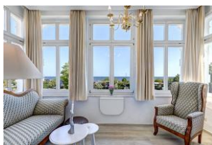
Blick in die Veranda