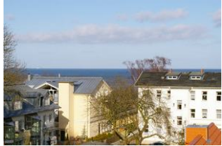
Seeblick vom Balkon