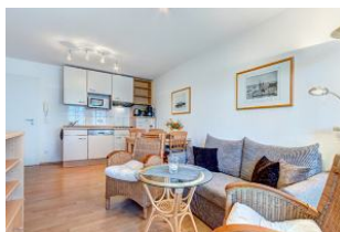
Wohnbereich, Essbereich, Küchenzeile