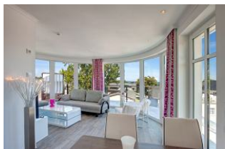
Blick in den Wohnraum

SEHR MODERN und mit SEEBLICK aus dem Wohnraum mit GROSSER FENSTERFRONT zur SEESEITE und von der GROSSEN DACHTERRASSE (ca. 55 qm mit Strandkorb und Möbeln). Mit FAHRSTUHL, nur ca. 100 m zur Strandpromenade! Luxuriös und komfortabel eingerichtete 2 - Zimmer - Wohnung mit sehr guter Ausstattung! Separates Schlafzimmer, ein zum Schlafzimmer offenes Bad mit großer walk-in-Dusche und Badewanne, ein separates WC. Der große Wohnbereich besticht durch eine gerundete Fensterfront und einen schönen Küchen- und Eßbereich, sowie einen KAMINOFEN. Die Wohnung verfügt über FUSSBODENHEIZUNG. Sie nimmt mit der großen Dachterrasse das gesamte Dachgeschoß des hinteren (seeseitigen) Hausteils ein. Zur Wohnung gehört ein STRANDKORB AM STRAND. Sie verfügt über einen Pkw-Stellplatz in der teilüberdachten Tiefgarage. Fahrradabstellfläche ist vorhanden. Vom Haus aus können Sie das Ortszentrum und die Ahlbecker Seebrücke in ca. 2 Minuten zu Fuß erreichen.