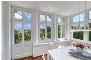
Essplatz in verglaster Veranda

Schicke 4-Zimmer-Wohnung mit Veranda und Terrasse - mit schönem weitem Blick! Die Wohnung ist elegant im Altbau-Stil eingerichtet und komfortabel ausgestattet. Sie wurde 2016 komplett renoviert mit Fußbodenheizung. Die Wohnung verfügt über drei separate Schlafzimmer, jeweils mit zugehörigem ensuite-Bad, Wohnzimmer mit Küchenzeile und Essplatz in der Veranda. Von den drei Bädern sind zwei Duschbäder und eines ein Wannenbad. Die Wohnung verfügt weiter über einen Eingangsflur mit Garderobe. Aus der Veranda gelangt man auf die möblierte Terrasse und in den Garten. Ein Pkw-Stellplatz ist inklusive, ein zweiter Parkplatz kann hinzugemietet werden. Die Villa Margarete steht etwas erhöht in der Bergstrasse, wodurch sich ein schöner Blick ergibt. Die Wohnung befindet sich im EG, etwa 300m zur Strandpromenade. Zum Ortszentrum und der bekannten Ahlbecker Seebrücke sind es ca. 8-10 Minuten zu Fuß.