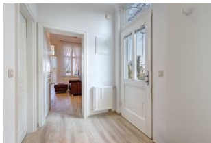
Eingangsfloor mit Blick zum Wohn-/Essbereich