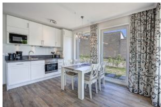
Essplatz und Küche