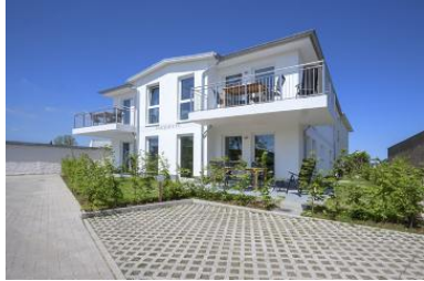
Hausansicht Neubau Villa Margarete