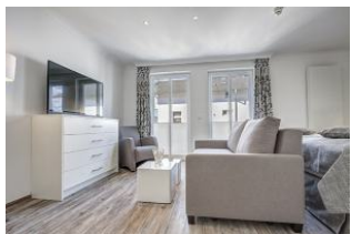
Couch und Flachbild TV