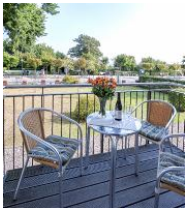
Balkon im Sommer