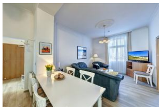
Wohnraum mit direktem Zugang zum Garten und dortiger Terrasse

Direkt an der Strandpromenade mit großem GARTEN und SÜDBALKON! Schönes komfortables 4 - Zimmer - Apartment mit guter und vollwertiger Ausstattung. Drei separate Schlafzimmer, separate Küche, zus. Essplatz im Wohnraum, Duschbad und Gäste-WC, Wohnraum mit direktem Gartenzugang und Terrasse, Südbalkon mit Sonne bis abends. Die Wohnung verfügt über einen Pkw-Stellplatz. In der Garage können Fahrräder und ähnliches untergestellt werden. Im Haus gibt es eine Sauna. Von der "Villa Germania" aus können Sie das Ortszentrum und die bekannte Ahlbecker Seebrücke in ca. 3 Minuten zu Fuß erreichen. Zum Strand sind es 50 m. Von Mai bis September ist ein Strandkorb im Tagespreis enthalten!