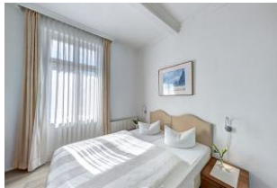
Schlafzimmer 1 mit Zugang zum Balkon