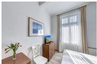
Schlafzimmer 1 mit Zugang zum Balkon