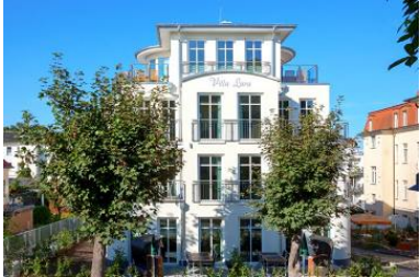
Hausansicht aus der Architektenplanung