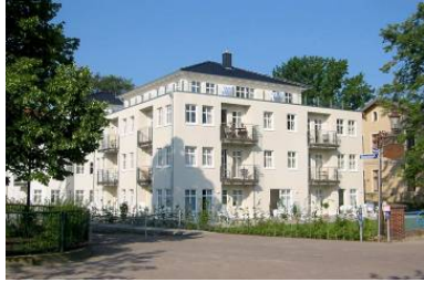
Hausansicht "Villa Aquamarina" von der Promenade