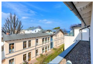
Dachterrasse (Blick seitlich)