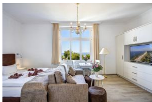
Schlafen, Wohnen, Essen