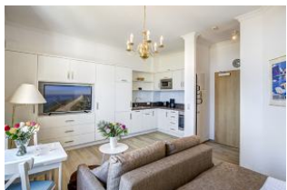
Wohnen, Essen, Küche