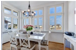
Essplatz in der Veranda mit schönem Ausblick

Geräumige helle 4-Zimmer-Wohnung mit Veranda Richtung Ostsee - mit schönem weitem Blick! Die Wohnung ist gemütlich und freundlich eingerichtet und ausgestattet. Sie wurde 2014 renoviert, die Bäder und Küche sind dann neu gemacht worden. Die Wohnung verfügt über drei separate Schlafzimmer, Wohnzimmer mit Küchenecke und Essplatz in der Veranda, ein Bad mit Wanne und Dusche, ein kleines Duschbad und einen Eingangsflur mit Garderobe. Die Wohnung verfügt über einen großen Balkon mit Esstisch. Zur Wohnung gehört ein kostenfreier Pkw-Stellplatz auf dem Grundstück. Ein zweiter kann hinzugemietet werden. Die Villa Margarete steht etwas erhöht in der Bergstraße, wodurch sich der weite Blick ergibt. Die Wohnung befindet sich im I. OG, etwa 300m zur Strandpromenade. Von der Villa Margarete aus können Sie das Ortszentrum und die bekannte Ahlbecker Seebrücke in ca. 8-10 Minuten zu Fuß erreichen.