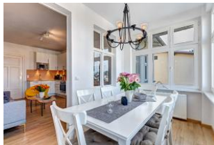
Veranda - Blick in den Wohnbereich mit Küche