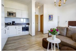
Blick zum Flur und zur Badtür