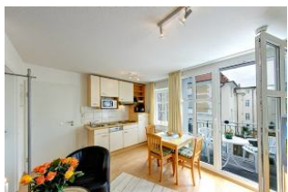
Küche mit Esszimmer

Direkt an der Strandpromenade mit SÜDBALKON und FAHRSTUHL im Haus! Schönes geräumiges 2-Zimmer-Apartment mit geschmackvoller guter Ausstattung. Separates Schlafzimmer (mit Fernseher), Wohnzimmer mit Küchenzeile und Essplatz, Duschbad, Balkon nach Süden mit Sonne bis abends. Die Wohnung verfügt über einen Tiefgaragen-Pkw-Stellplatz. In der Garage können auch Fahrräder und ähnliches untergestellt werden. In unserer "Villa Germania" nebenan gibt es eine Sauna. Von der "Villa Aquamarina" aus können Sie das Ortszentrum und die bekannte Ahlbecker Seebrücke in ca. 3 Minuten zu Fuß erreichen. Zum Strand sind es 50 m.