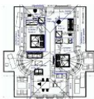
Wohnungsgrundriss (Möblierung exemplarisch)