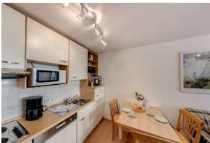
Küche mit Essbereich