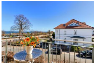
Balkon mit Ausblick