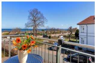
Balkon mit Ausblick