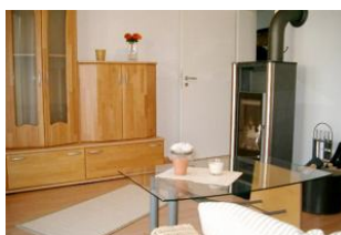
Wohn-/Schlafzimmer mit Kaminofen und Schlafcouch (140 cm) für 5. und (wenn gewünscht) 6. Person