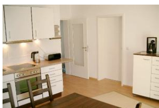
Gut ausgestattete Küche mit großem Essplatz

Strandnah mit SÜDTERRASSE, Balkon und KAMINOFEN! Großzügige und gut ausgestattete 3-Zimmer-Wohnung mit zwei separaten Schlafzimmern, großer Küche mit Eßplatz, Wohn-/Schlafzimmer mit Kaminofen und 140 cm Schlafcouch für die 5. Person, Bad mit Wanne und Dusche, zusätzliches Duschbad, Eingangsflur. Die Wohnung hat einen separaten Eingang. Vom Haus aus können Sie das Ortszentrum und die bekannte Ahlbecker Seebücke in ca. 3 Minuten zu Fuß erreichen. Zum Strand sind es ca. 80 m Luftlinie. Für Brennholz muß - wenn Kaminofennutzung gewünscht ist - selbst gesorgt werden (im nahegelegenen Supermarkt oder bei uns erhältlich). Diese Wohnung verfügt nicht über WLAN.