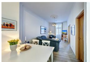
Wohnraum mit direktem Zugang zum Garten und dortiger Terrasse