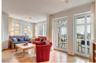
Wohnbereich und Blick Richtung Meer