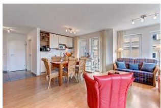
Wohnen und Essen