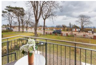
Balkon im Winter