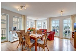
Essplatz und Blick zum Wohnbereich

1. Reihe, direkt an der Strandpromenade mit SEEBLICK und FAHRSTUHL im Haus! Geräumiges und geschmackvoll eingerichtetes 3-Zimmer-Apartment mit moderner guter Ausstattung. Zwei separate Schlafzimmer (eines davon mit 2. Fernseher), Wohnzimmer mit Küchenzeile und Essplatz, Bad mit Wanne und Dusche, Gäste-WC, Balkon zur Seeseite mit ausschnittweisem Seeblick, zus. ein kleiner Balkon neben der Küche. Küchenzeile zusätzlich mit Espressomaschine, Wasserkocher, Eierkocher, Mixer, elektr. Zitruspresse. Die Wohnung verfügt über einen Tiefgaragen-Pkw-Stellplatz. Von der "Villa Aquamarina" aus können Sie das Ortszentrum und die bekannte Ahlbecker Seebücke in ca. 3 Minuten zu Fuß erreichen. Zum Strand sind es 50 m.