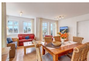
Essplatz und Blick zu Wohnbereich und Balkon