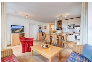
Wohnen und Essen