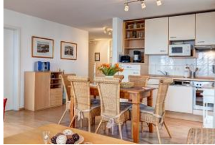
Küchenzeile und Essplatz