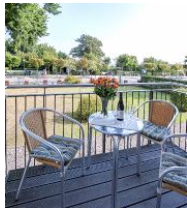
Balkon im Sommer