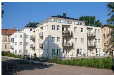
Hausansicht "Villa Aquamarina" von der Promenade