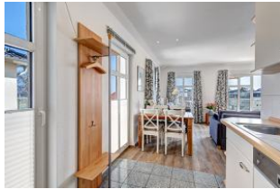
Küchenzeile mit Blick zum Essplatz