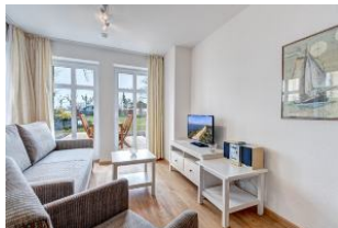
Wohnbereich mit Blick zur Terrasse