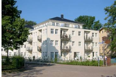
Hausansicht "Villa Aquamarina" von der Promenade