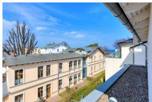
Dachterrasse (Blick seitlich)