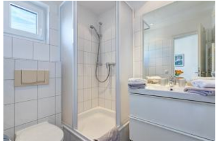
Duschbad mit kleinem Fenster