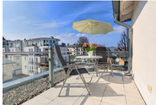
Dachterrasse nach Süden mit Essplatz