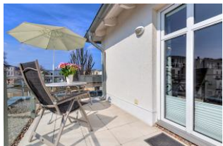
Dachterrasse nach Süden mit Essplatz