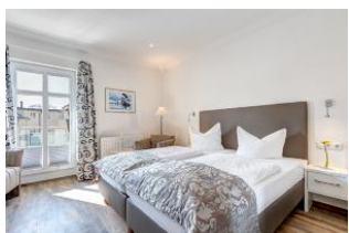
Schlafbereich und Sitzgelegenheit, Zugang zur Dachterrasse

1. Reihe an der Strandpromenade mit DACHTERRASSE und FAHRSTUHL im Haus! Chices 1-Zimmer-Apartment mit moderner guter Ausstattung. Kombiniertes Wohn-/Schlafraum, separate Küche mit Essplatz, Duschbad, Dachterrasse nach Süden mit Sonne bis abends. Die Wohnung verfügt über einen Pkw-Stellplatz. In der Garage können auch Fahrräder und ähnliches untergestellt werden. In unserer "Villa Germania" nebenan gibt es eine Sauna. Von der "Villa Aquamarina" sind es zum Ortszentrum und der Seebrücke ca. 3 Minuten zu Fuß. Zum Strand sind es 50 m.