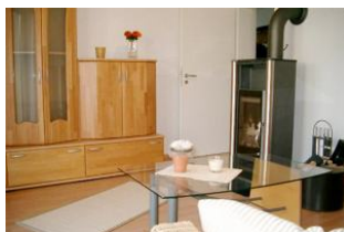
Wohn-/Schlafzimmer mit Kaminofen und Schlafcouch (140 cm) für 5. und (wenn gewünscht) 6. Person