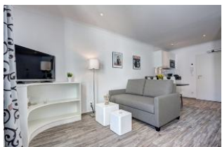
TV und Couch