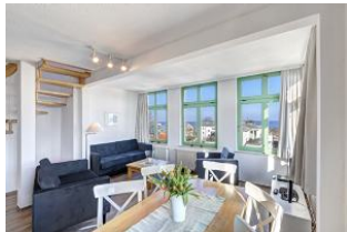
Wohnen / Essen / Aufgang

STRANDNAH mit SEEBLICK und BALKON! Nur ca. 100 m zur Strandpromenade! FAHRSTUHL im Haus. Schönes großes Maisonette-Apartment mit 4 Zimmern auf zwei Ebenen, gute Ausstattung. 3 Schlafzimmer, Wohnzimmer mit vollwertiger Küchenzeile und Essplatz, Duschbad (untere Ebene), Wannenbad (obere Ebene), zus. Gäste-WC, Eingangsflur, Balkon. Die Wohnung verfügt über einen Pkw-Stellplatz. Seeblick über die vorstehenden Häuser hinweg. Abstellraum für Fahrräder und ähnliches ist vorhanden. Vom Haus aus können Sie das Ortszentrum und die bekannte Ahlbecker Seebrücke in ca. 3 bzw. 5 Minuten zu Fuß erreichen.