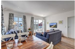
Essplatz mit Blick in den Wohnbereich