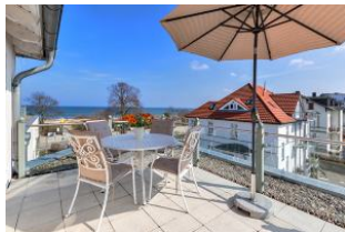
Dachterrasse mit tollem Meerblick