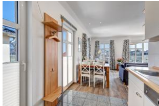
Küchenzeile mit Blick zum Essplatz