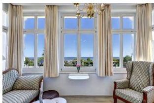
Veranda mit Seeblick