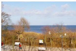
Seeblick aus der Veranda